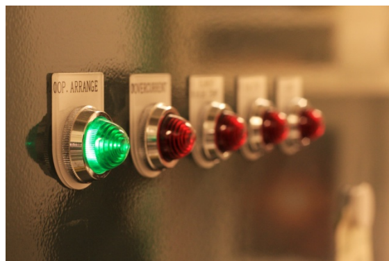
Bild 1 visar detaljbild av Diamorphs pilotanläggning.

Det har varit en händelserik period där Diamorph har växt ur sina gamla lokaler och flyttat in i Albanovaområdet vid Roslagstull. Området är forskningsintensivt med närhet till universitet vilket är bra, då vi fortfarande har goda relationer och samarbete med universitets forskare. I anslutning till de nya lokalerna ligger Diamorphs nyinstallerade pilotanläggning. Ett flertal maskiner har köpts in och installerats för att få i gång Diamorphs oberoende forsknings- och produktionsverksamhet.