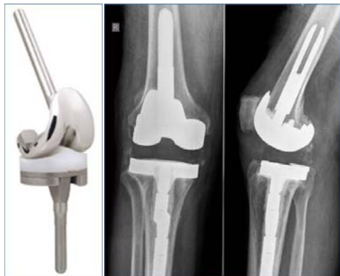
Bild 2 visar en av de nuvarande lösningarna med protes

Diamorph har i samarbete med ledande forskare framgångsrikt tagit fram en ny form av implantat som kan förebygga och behandla broskskador i leder som t ex artros. I första skedet ligger Diamorphs fokus på skadade knäleder. Den första prototypen är klar och prekliniska studier har inletts. Diamorphs nya implantat är extremt små och tunna och kan skräddarsys för att passa olika typer av förslitningskador. Det nya implantatet är ett stort steg framåt från den rigorösa mekaniska fixeringen med skruvar och bencementering som idag är vanlig vid behandling av dessa skador.